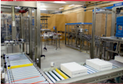
Dwie linie pakujące zintegrowane z jednym systemem paletyzującym