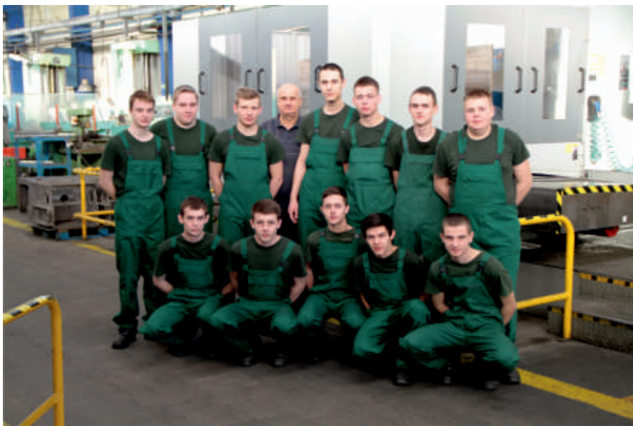
Uczniowie odbywający praktyki w TREPKO

Wszystkim absolwentom oferujemy zatrudnienie w pełnym wymiarze godzin. Otrzymują oni szanse oraz wsparcie w rozwijaniu swoich umiejętności również w innych dziedzinach. Dzięki temu mają możliwość wzbogacania swoich doświadczeń zawodowych. W ten sposób TREPKO wprowadza unikalny model realizujący zarówno własne potrzeby posiadania wykwalifikowanego personelu, jak również indywidualne potrzeby stabilnego miejsca pracy i szans rozwoju zawodowego. ■