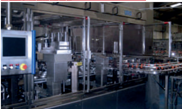
Maszyna liniowa - Wenezuela