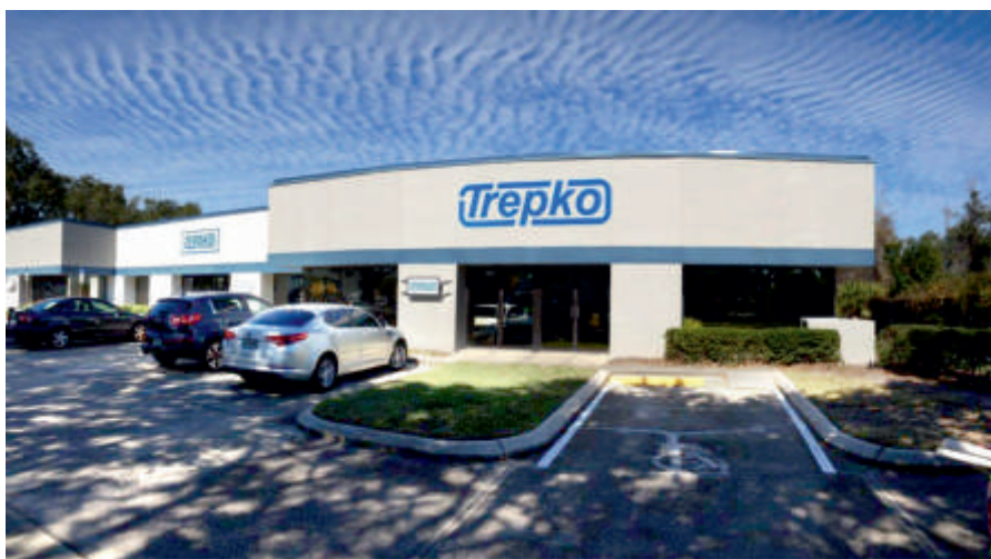
Biuro regionalne w USA - TREPKO Inc.

Po udanych 18 miesiącach działalności nowego biura regionalnego TREPKO Inc. w Tampie na Florydzie, zdecydowaliśmy się powiększyć dwukrotnie swoją siedzibę. Rozbudowaliśmy warsztat oraz powierzchnię wystawową dla automatów TREPKO. Zmodernizowaliśmy recepcję oraz biura sprzedażowe.