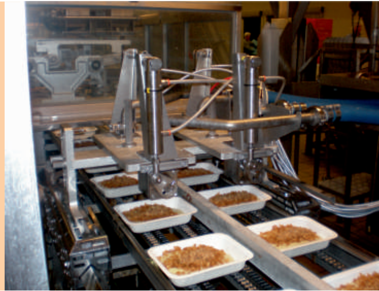
Seria 620 - system dozujący sos

Precyzja i stabilność to kluczowe zasady, jakimi kieruje się firma Tulip Food, jedna z największych przetwórci mięsnych w Europie. Firma Tulip wybrała TREPKO, jako dostawcę systemu dozowania nowej linii produkcji dań gotowych.