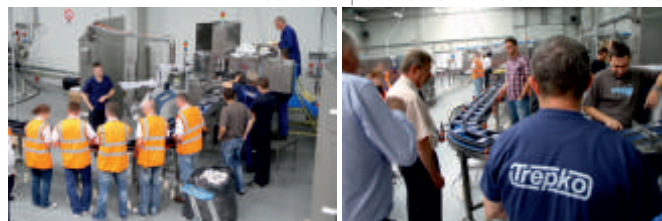
Centrum pokazowo - szkoleniowe TREPKO

Odpowiednio wykonana procedura FAT nie jest tylko kolejnym punktem w harmonogramie TREPKO. Im więcej wysiłku włożymy w ten etap projektu, tym płynniejsze stają się kolejne etapy: dostawa, montaż i uruchomienie. Jako pewny i otwarty partner, zapewniamy kompleksowe podejście do testów odbioru technicznego przy pełnym zaangażowaniu. Te działania mają na celu spełnienie wymogów zawartych w kontrakcie oraz budowanie wzajemnego zaufania. ■