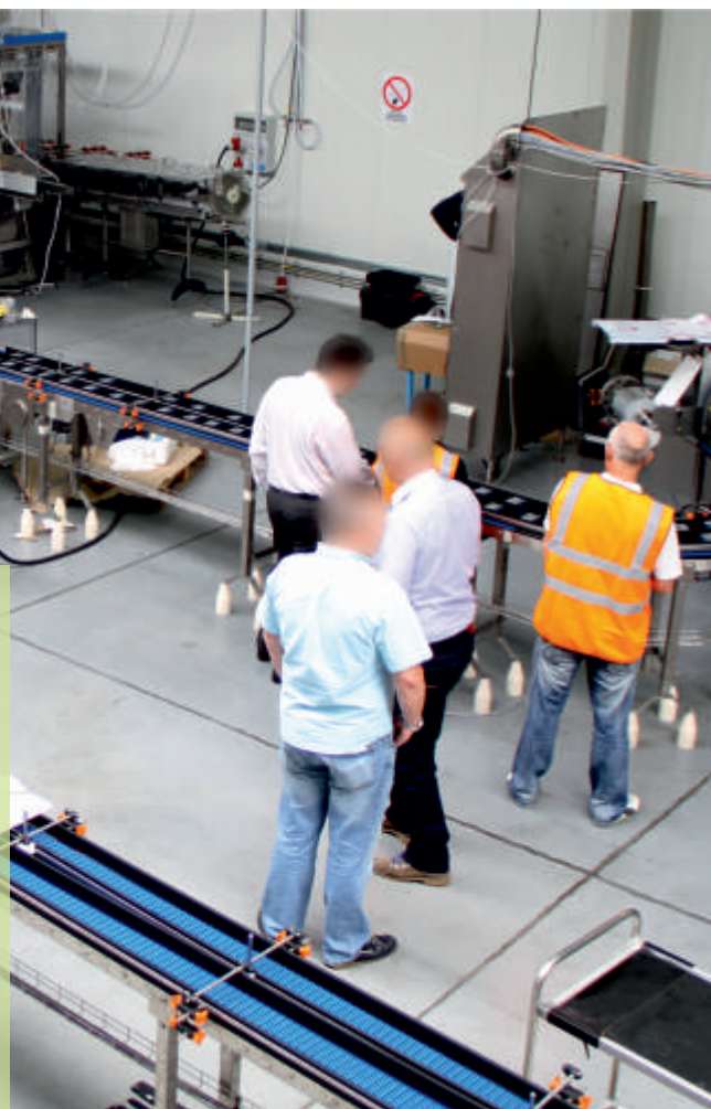
Centrum pokazowo - szkoleniowe TREPKO

W przemyśle maszynowym test odbioru technicznego (Factory Acceptance Test) uznaje się za jeden z kamieni milowych podczas realizacji projektów. Przeprowadza się go przed dostawą urządzeń, w celu potwierdzenia spełnienia wymogów zawartych w kontrakcie. Procedura ta stanowi zwykle standardową część umowy.