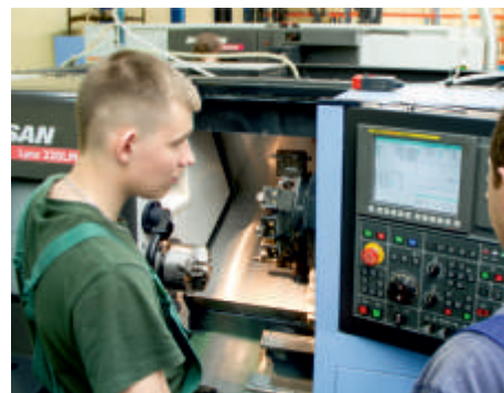
Uczeń podczas pracy przy obrabiarce CNC